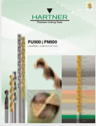
▼ FU 500 / FN 500