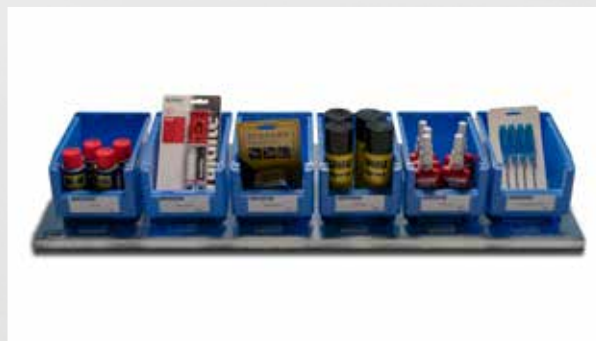
Fachbodenvariante mit Sichtlagerkästen 6 x 4 kg