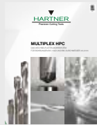
▼ MULTIPLEX HPC