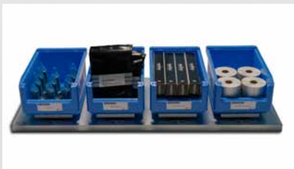
Fachbodenvariante mit Sichtlagerkästen 4 x 20 kg