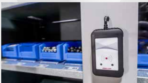
Lesegerät zur Authentifizierung bei Stand-Along-Einheit