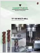
▼ TF 100 MULTI-MILL