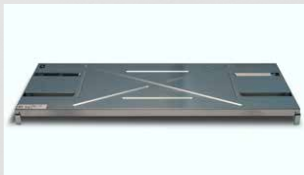
Fachbodenvariante 1 x 80 kg