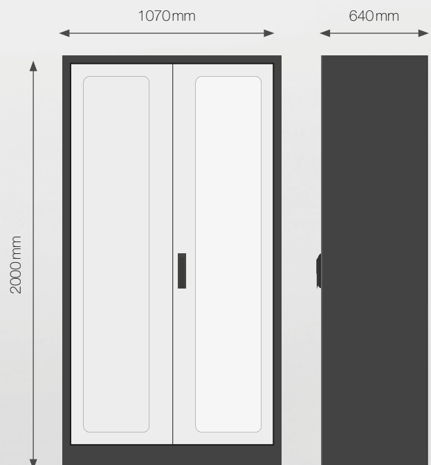
TM 626 ohne Sichtfenster | Front- & Seitenansicht