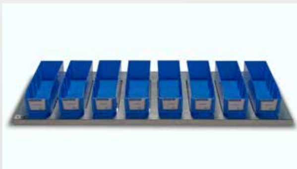
Fachbodenvariante mit Sichtlagerkästen 8 x 4 kg